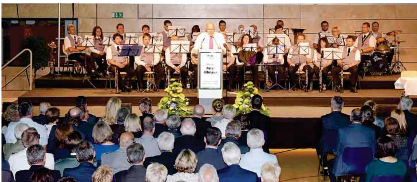
In tollem Ambiente hielt Kanzleramtschef Peter Altmaier die Festrede beim ersten Bürgerempfang der Stadt Meßstetten.