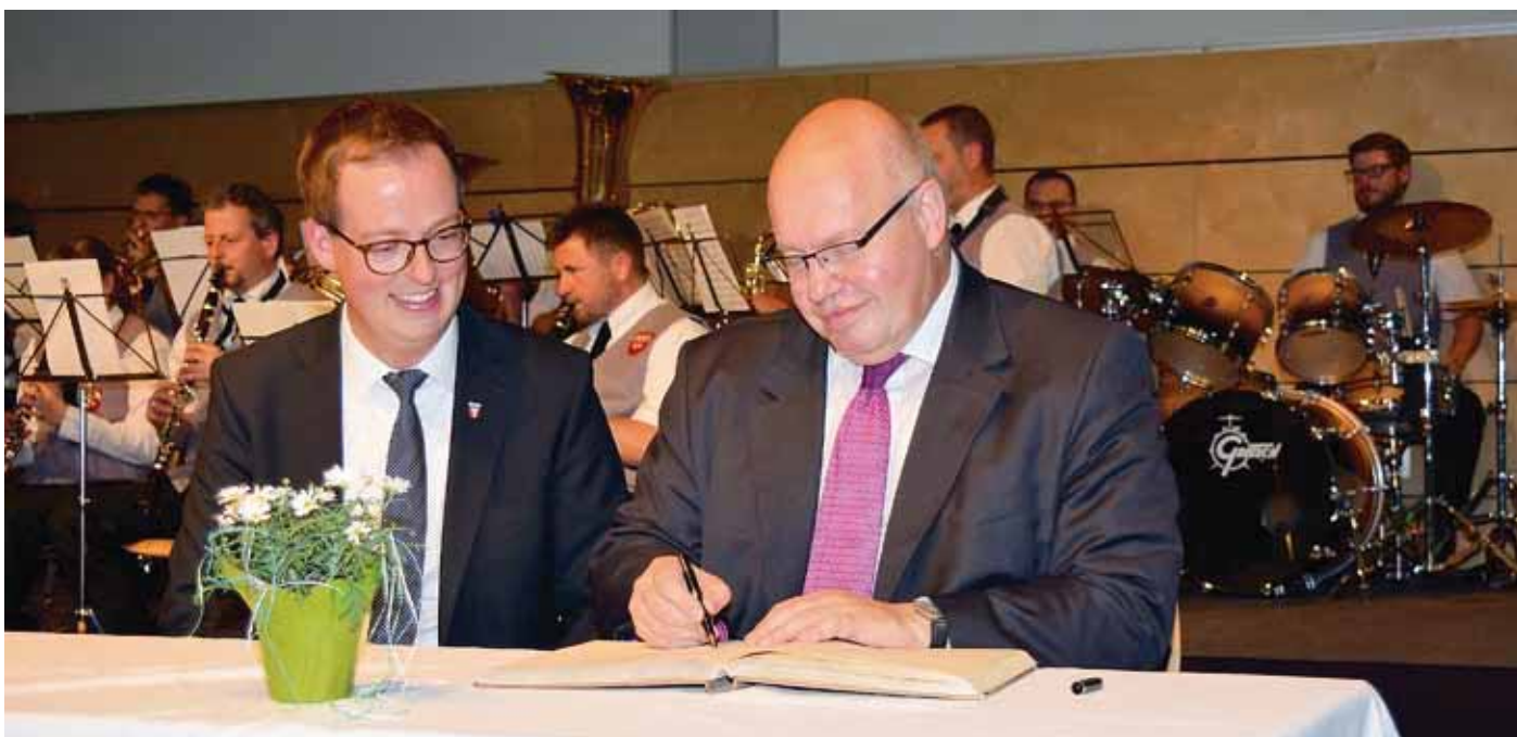
Bundesminister Peter Altmaier trägt sich ins Goldene Buch der Stadt Meßstetten ein.

In seiner zitatenreichen Rede beleuchtete er die Herausforderungen des technischen und demographischen Wandels für den ländlichen Raum. Die Digitalisierung bezeichnete er als eine epochale Zäsur, die aber durchaus den Regionen abseits der Ballungsräume Chancen biete, falls sie nicht von der großen Politik vernachlässigt würden. Gerade die Digitalisierung ermögliche Wohnen und Arbeiten an einem Ort in einer idyllischen Landschaft mit hohem Freizeitwert, zudem sei die funktionierende nachbarschaftliche Hilfe ein hohes Stück Lebensqualität. Mit der „Agenda Meßstetten 2030“ sei die Stadt dabei, die Voraussetzungen für einen gelingenden Strukturwandel zu schaffen.