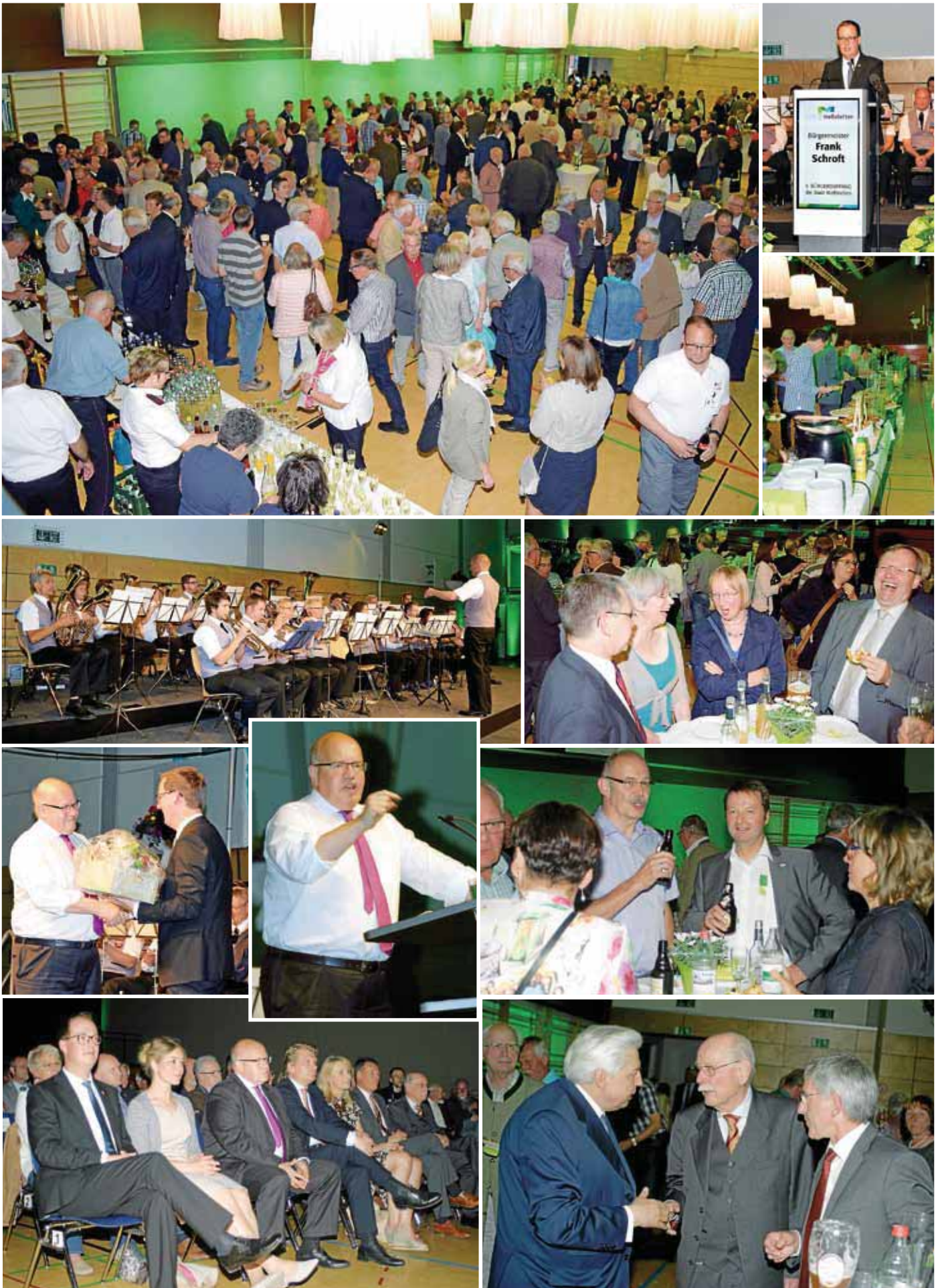
Weitere Bilder vom Bürgerempfang finden Sie unter www.messstetten.de