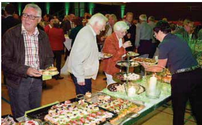
Bei einem reichhaltigen Imbiss lobten die Bürgerinnen und Bürger den gelungenen Abend.

Obwohl auf den gebürtigen Saarländer bereits ein weiterer Termin in Meßkirch wartete, ließ er es sich doch nicht nehmen, gemeinsam mit Bürgermeister Schroft das Buffet im zunächst vom Vorhang abgetrennten Hallendrittel zu eröffnen. In kleinen und großen Gruppen standen die Bürgerinnen und Bürger noch viele Stunden an den Stehtischen. Sie aßen, tranken und lobten wortreich den gelungenen Abend.